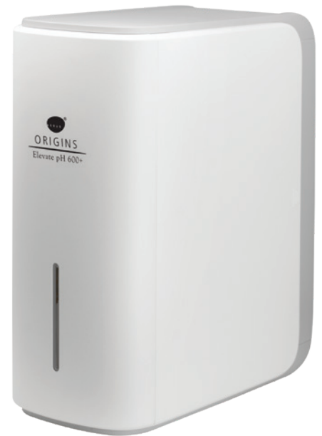
Incluye un grifo de ósmosis inversa dedicado, un tanque de 3.2 galones y toda la ferretería